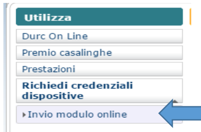
FIG. 4 – servizio on line Richiedi Credenziali dispositive – invia modulo