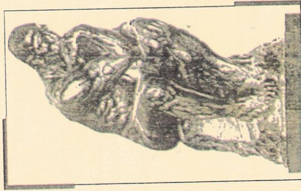
A. Rodin - Il Pensatore

“LA COMUNICAZIONE POLITICA OGGI. IL RUOLO DEI SOCIAL NETWORKS”